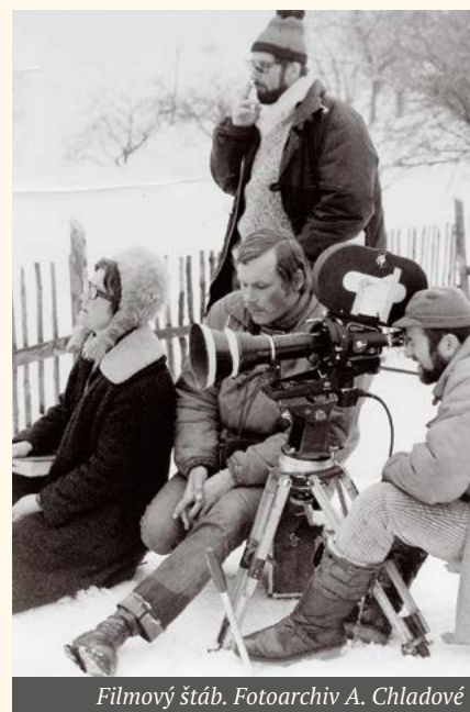
Filmový štáb.