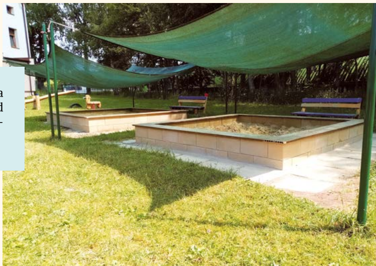
Dvě nová pískoviště v MŠ.

V mateřské škole nám vyrostla dvě nová pískoviště. Za ně vděčíme panu starostovi, který si vzal opravu pod svá křídla. Moc děkujeme. Děti už vyzkoušely bábovičky, nákladáky i stavění mostů a tunelů.