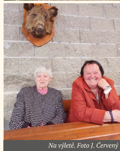
Na výletě.