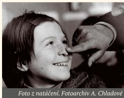
Foto z natáčení.

Vzpomínám, že režisérka přišla k nám domů a chtěla vidět můj šatník a oblečení, spousta věcí ve filmu je tedy mých vlastních, včetně toho krásného kulichu.