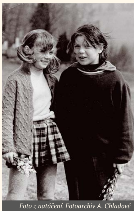
Foto z natáčení.