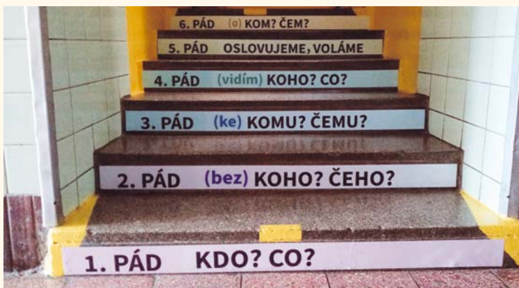
Výuková pomůcka na schodech.

Na prvním stupni základní školy po dvaceti letech prošly rekonstrukcí šatny pro žáky, ale i podlaha. Barvy rozzářily nejen prostory, ale i očka žáků. Sami si mohli vybrat, které barevné místo zaujmou. Čeká nás ještě nová podlaha v prvním patře. Na ni se těší hlavně paní školnice, protože po tomto linoleu sama chodila, když byla ještě v první třídě.