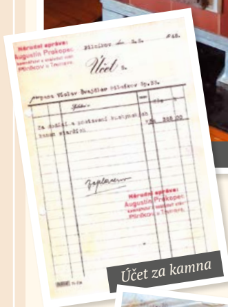
Účet za kamna