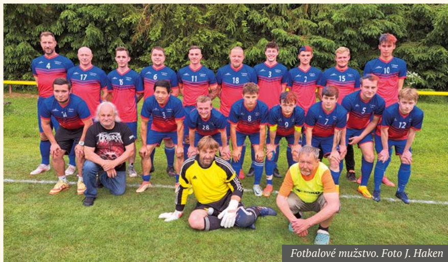
Fotbalové mužstvo.

Začneme našimi dětmi, které mají své jarní působení v soutěžích už skoro za sebou. Výsledky jsme příliš neřešili, prioritou pro nás je udržet alespoň nějaké děti u sportu, v tomto případě u fotbalu. Začíná to být v dnešní době docela značný problém! Proto kdo má chuť, ať přivede své ratolesti k nám na hřiště, a uvidíme, zda se pro tento typ činnosti nadchnou.