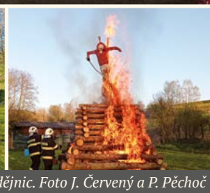
Slet čarodějnic.