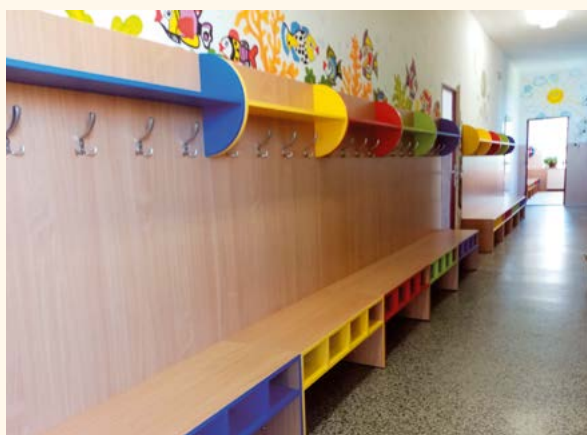
Šatny žáků v ZŠ.

Na prvním stupni základní školy po dvaceti letech prošly rekonstrukcí šatny pro žáky, ale i podlaha. Barvy rozzářily nejen prostory, ale i očka žáků. Sami si mohli vybrat, které barevné místo zaujmou. Čeká nás ještě nová podlaha v prvním patře. Na ni se těší hlavně paní školnice, protože po tomto linoleu sama chodila, když byla ještě v první třídě.