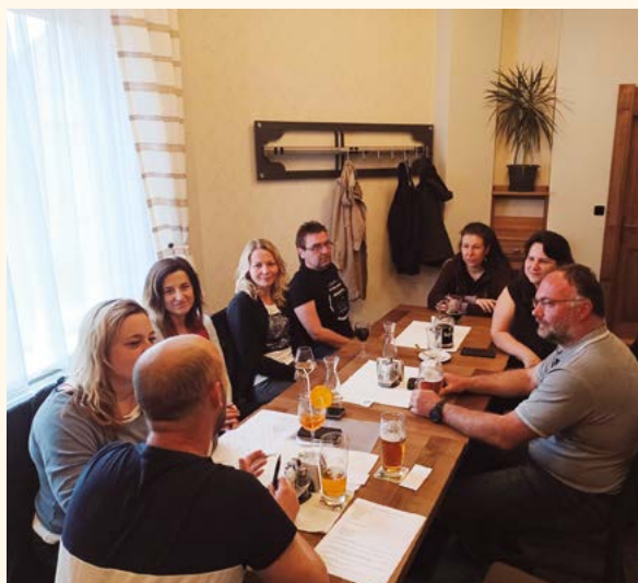
Setkání SRPDŠ (Sdružení rodičů, přátel a dětí školy).

V rámci výuky a opakování se žákům jak na prvním, tak na druhém stupni změnilы schody na výukové pomůcky. Takže než dojdou do třídy, procvičí očima i nohama pádové otázky, vyjmenovaná slova nebo násobilku.