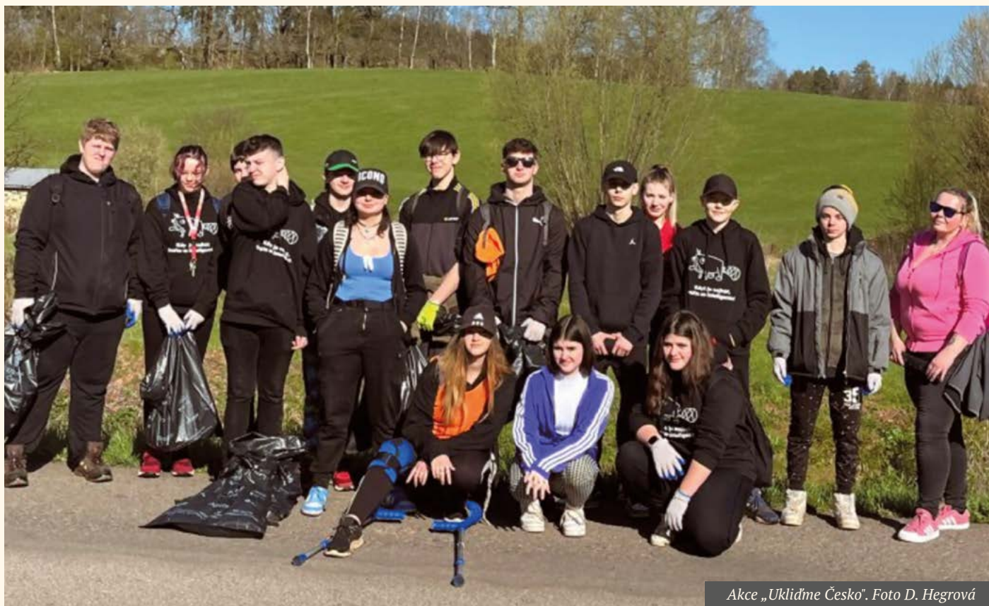
Akce „Uklidíme Česko“.

Žáci 5. až 9. třídy se opět zapojili do akce „Uklidíme Česko“. Nejvíce bylo plastových a plechových odpadků. Jen cestou po Hradčině, okolo penzionu směrem na hlavní silnici nasbírali 1 200 cigaretových nedopalků. Celkově žáci i pedagogové konstatovali, že letos bylo po městě a okolí nejméně nepořádku.