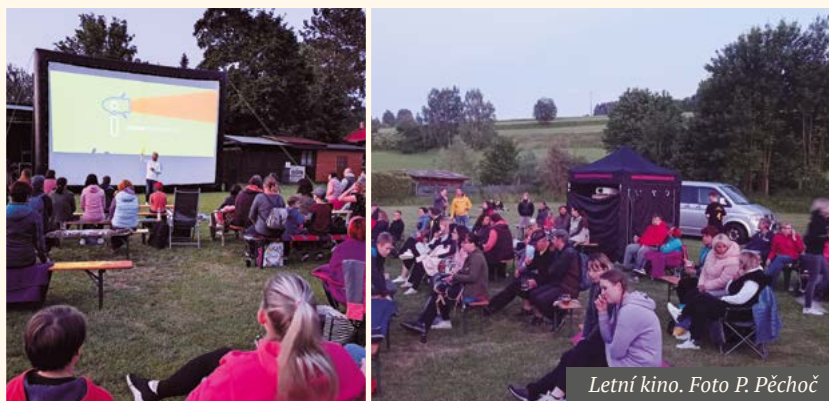
Letní kino.