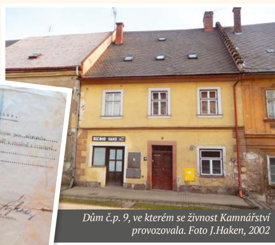
Dům č.p. 9, ve kterém se živnost Kamnářství provozovala. Foto J.Haken, 2002