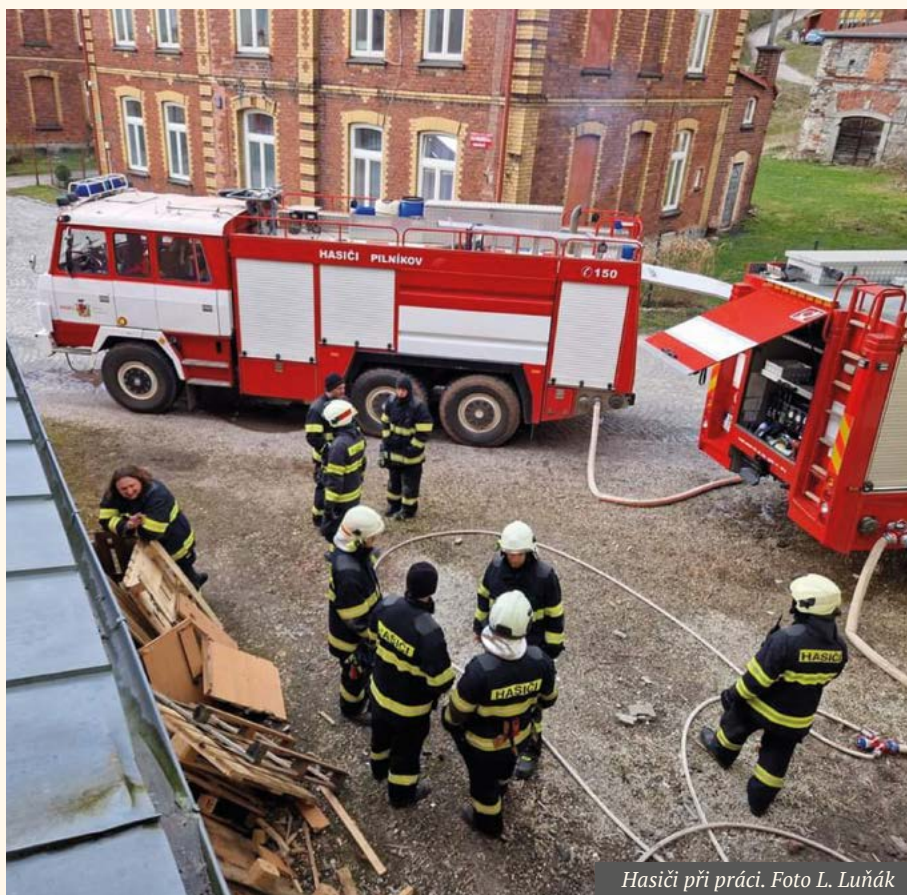
Hasiči při práci.