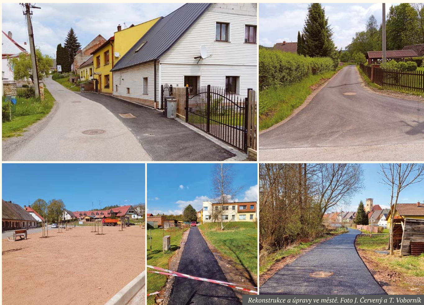
Rekonstrukce a úpravy ve městě.