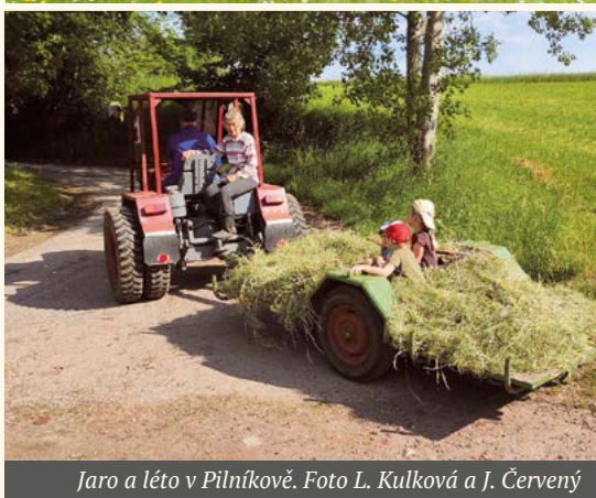
Jaro a léto v Pilníkově.