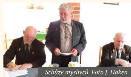
Schůze myslivců.