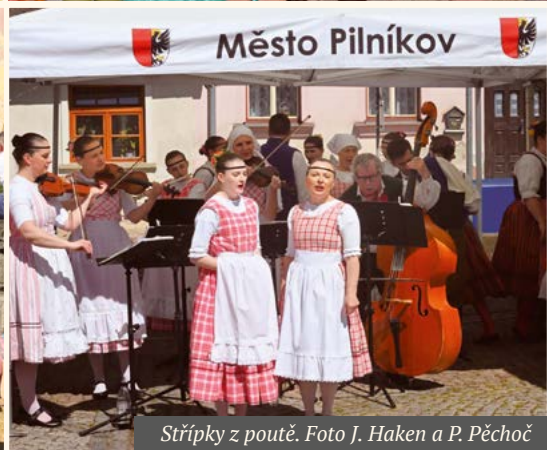
Střípky z poutě.