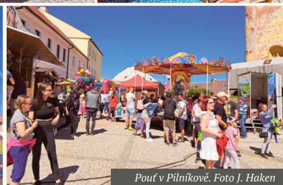
Pouť v Pilníkově.