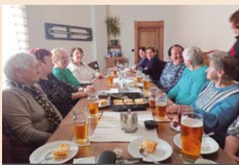
Setkání o páté.