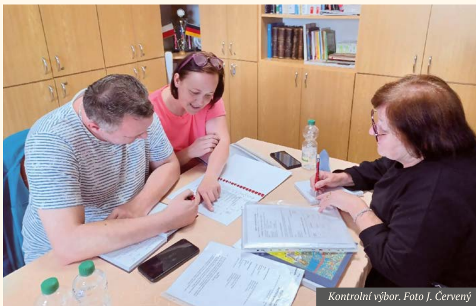
Kontrolní výbor.