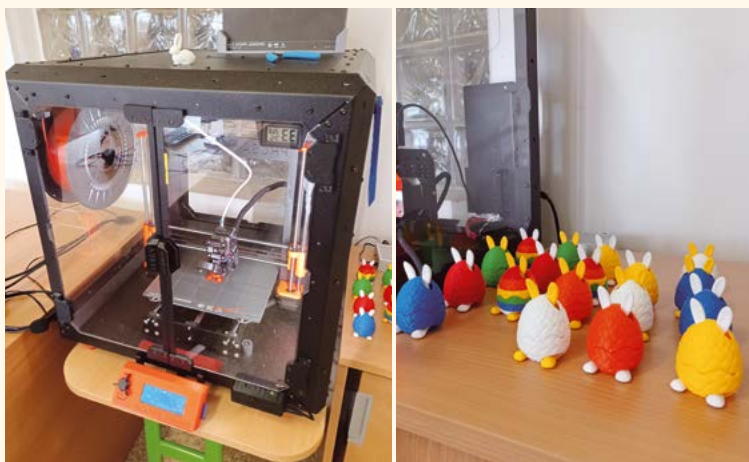
ZŠ - 3D tiskárna.