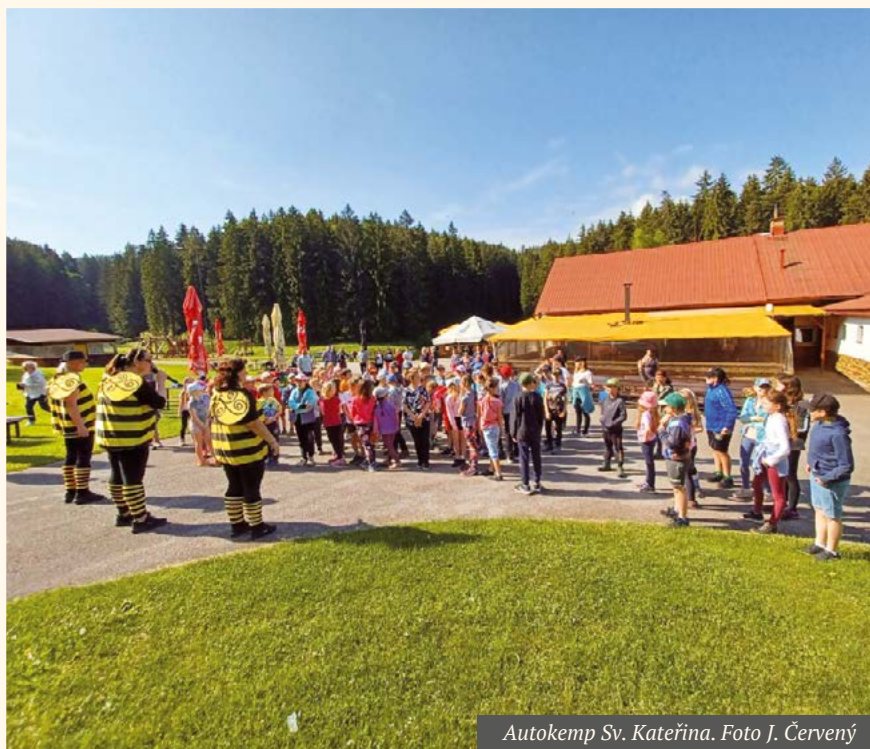
Autokemp Sv. Kateřina.

Iva Vašatová, koordinátorka akce Podkrkonošská Sněženka 2023