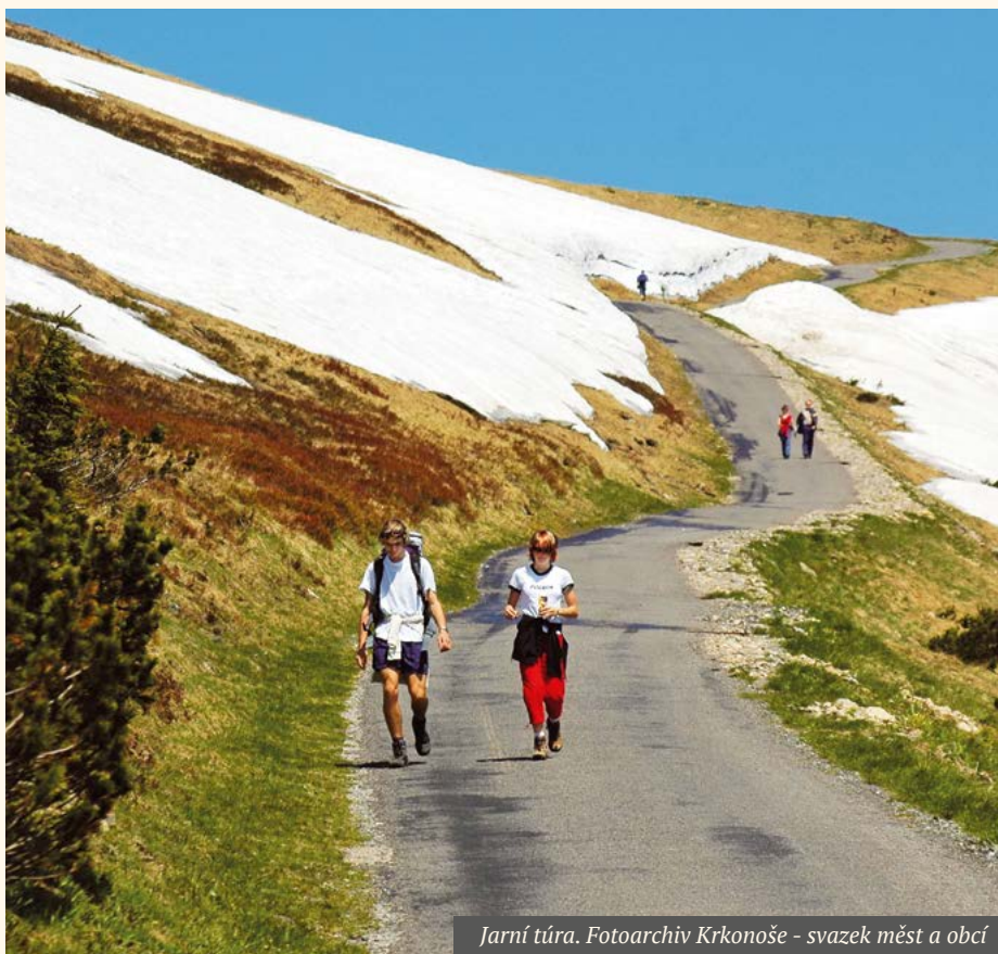
Jarní túra.

Oblíbené turistické noviny Krkonošská sezona dostaly nový kabát a jsou pro vás