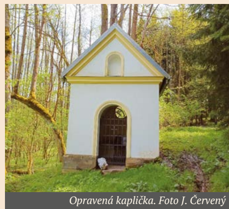
Opravená kaplička.