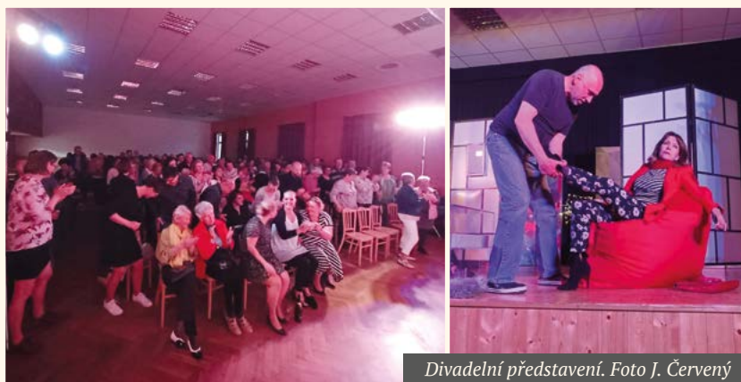
Divadelní představení.