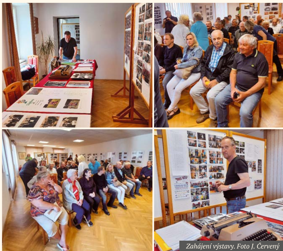
Zahájení výstavy.